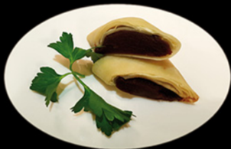
CREPES DI SOIA