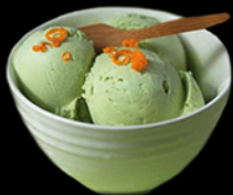
GELATO AL THE VERDE