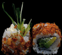
ROLL CRUNCH CALIROLL

cod 128 - € 12,00 Melone con philadelphia spicy salmone e cipollotti