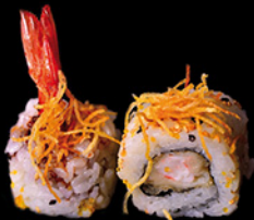
URAMAKI EBI TEN

cod 116 - € 9,00 Surimi di granchio, avocado, maionese