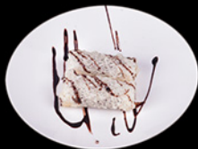
DOLCE ALLA CREMA DI TAROS