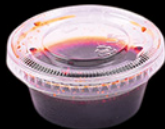
SALSA DI SOIA