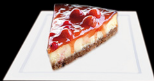
CHEESECAKE ALLE FRAGOLE