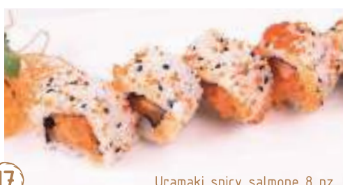
17 Uramaki spicy salmone 8 pz