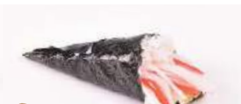
29 Temaki california 1 pz