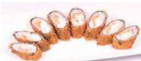
23 Hossomaki fritti 8 pz