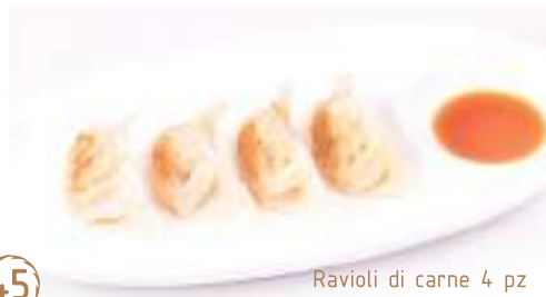
Ravioli di carne 4 pz