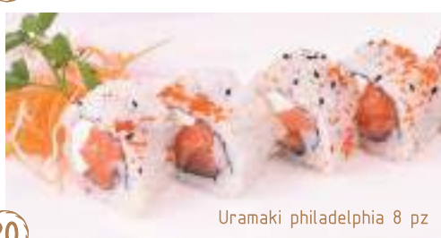
20 Uramaki philadelphia 8 pz