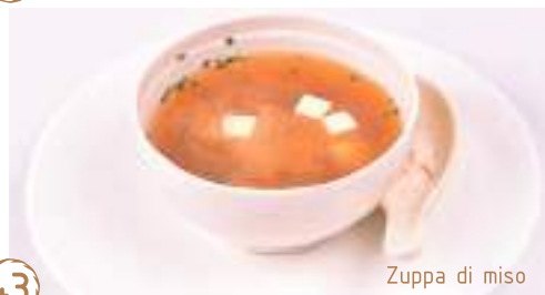
Zuppa di miso