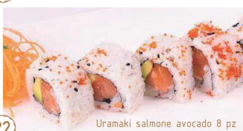
22 Uramaki salmone avocado 8 pz