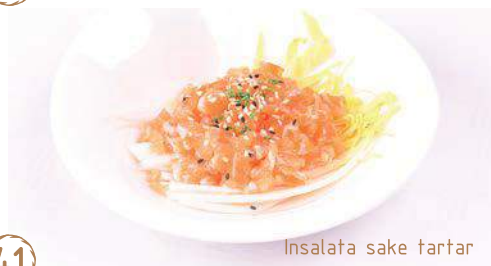
Insalata sake tartar