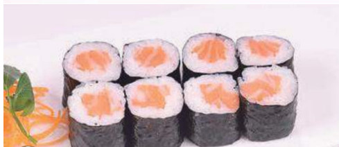
24 Hossomaki sake 8 pz