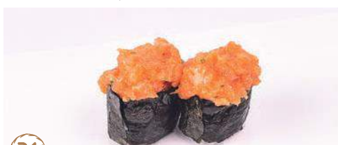
31 Gunkan spicy sake 2 pz

30. TEMAKI EBITEN* € 3,50 gamberone fritto