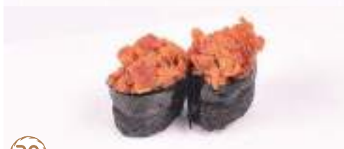
32 Gunkan spicy tonno 2 pz