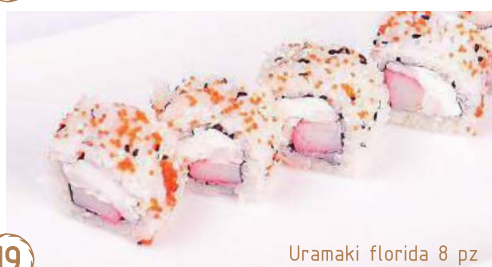
19 Uramaki florida 8 pz