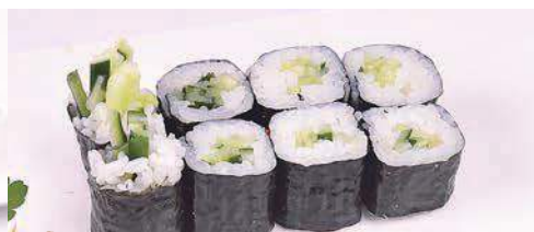
25 Hossomaki kappa 8 pz