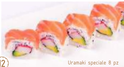
12 Uramaki speciale 8 pz