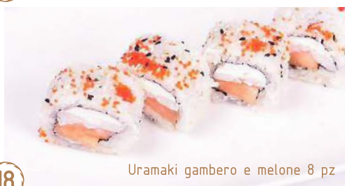
18 Uramaki gambero e melone 8 pz