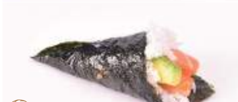
28 Temaki sake 1 pz