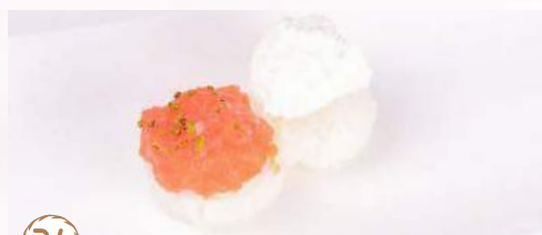
34 Gunkan polpette 2 pz

31. GUNKAN SPICY SAKE € 6,00 salmone,tabasco,cipollotti,maionese