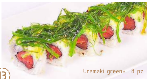
13 Uramaki green* 8 pz