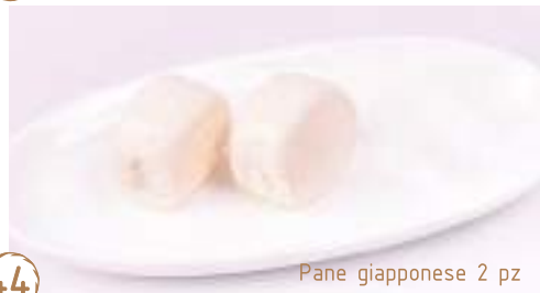
Pane giapponese 2 pz