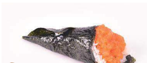
27 Temaki spicy sake 1 pz

26. HOSSOMAKI CALIFORNIA 8pz € 4,00 surimi di granchio,avocado e maionese