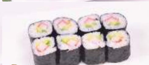
26 Hossomaki california 8 pz

23. HOSSOMAKI FRITTI 8pz € 8,00 salmone,philadelphia