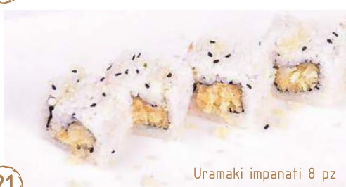
21 Uramaki impanati 8 pz