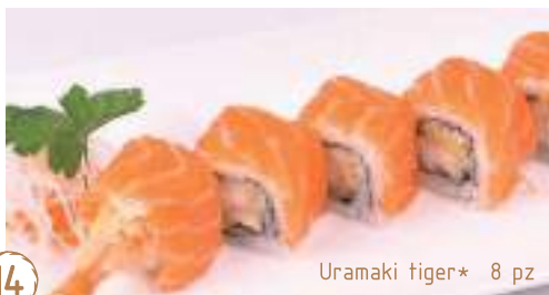
14 Uramaki tiger* 8 pz