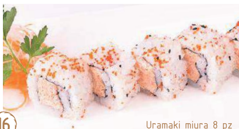
16 Uramaki miura 8 pz