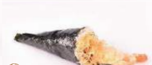
30 Temaki ebiten* 1 pz

27. TEMAKI SPICY SAKE € 4,00 salmone,tabasco,cipollotti,maionese