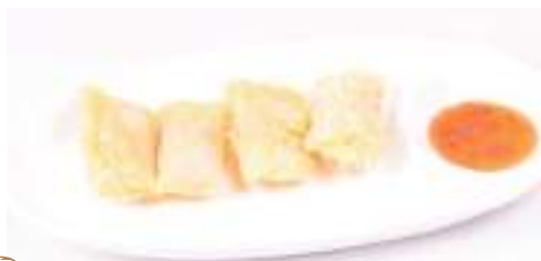
Involtino giapponese 4 pz