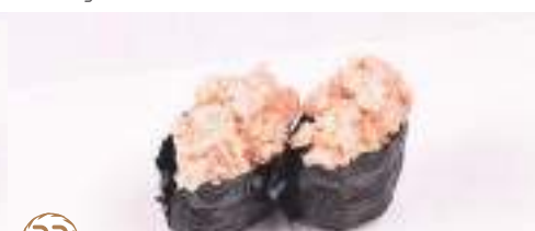
33 Gunkan salmone grigliato 2 pz