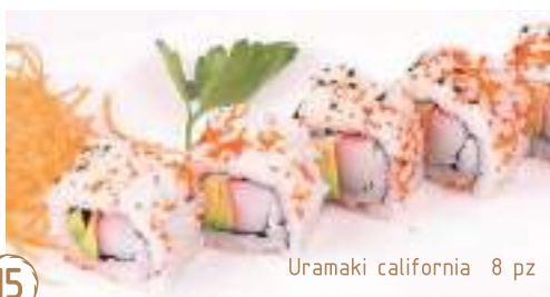
15 Uramaki california 8 pz